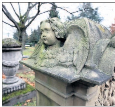
Besondere Grabmale bleiben: An der Stirnseite dieser Stätte verrät ein Äskulapstab, dass der Verbliebene Arzt war.

In der Zwischenzeit ist die Nutzungszeit vieler Gräber auf dem Stadtfriedhof abgelaufen, Dutzende wurden eingeebnet. „Wir haben 90 Grabsteine ausgesucht, die nicht verschwinden sollen“, sagt Schifferstadts Ordnungsamtsleiter Norbert Kühner. Ausschlaggebend für die Auswahl seien die Gestaltung der Steine und die Bedeutung der beigesetzten Personen für die Stadtgeschichte gewesen. Wie die Grabmäler später einmal aufgestellt werden,