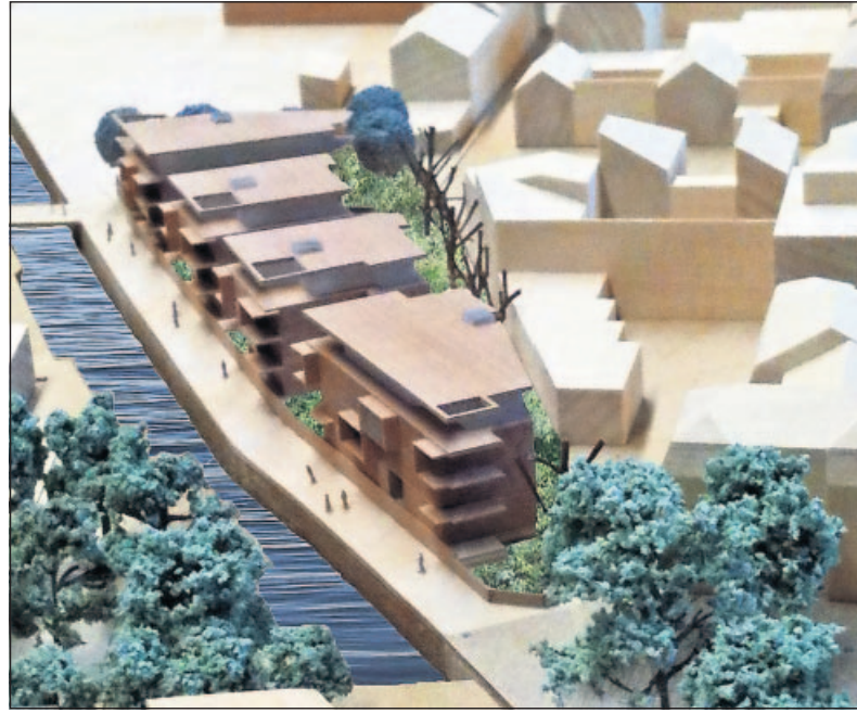
Das ist der Vorentwurf mit vier Solitäre Gebäuden an der Queich des Landauer Architekten Thorsten Arnold. Im Bauausschuss unterlag er mit seinen Vorstellungen.

Übrigens: In der Verlängerung der jetzt geplanten Wohnanlage soll zur Maximilianstraße, also zum Landauer Bahnhof hin, noch ein Hotelkomplex entstehen.