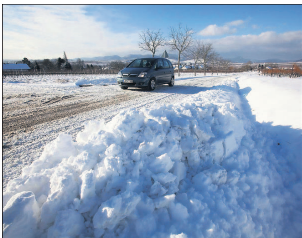
Schnee, Schnee, Schnee – hier in Godramstein.