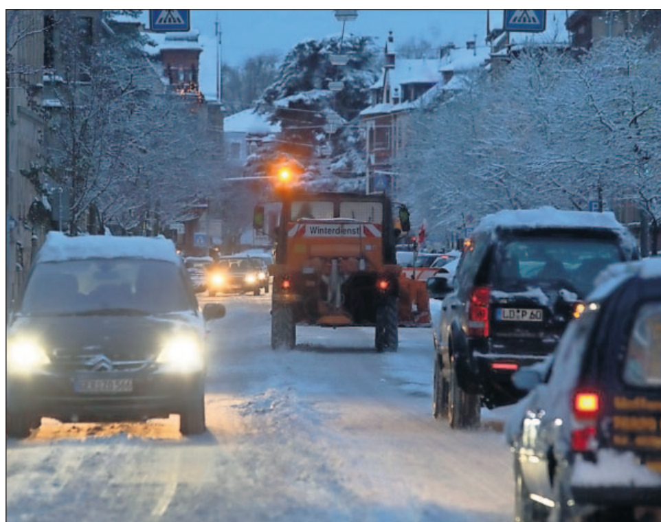
Weniger Verkehr als üblich war gestern kurz vor Schulbeginn im Westring.

Marktstraße 17 76887 Bad Bergzabern Telefon: 06343 937814 Telefax: 06343 5559 E-Mail: redber@rheinpfalz.de