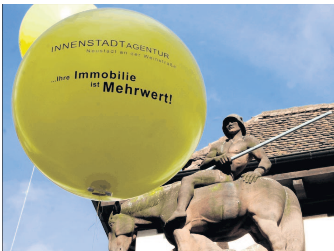
Die Innenstadtagentur hat mit publikumswirksamen Vermittlungsaktionen Immobilienbesitzer und Kaufinteressenten zusammengebracht.